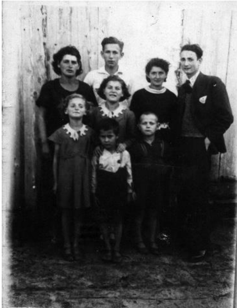
תמונה משפחתית בקילצה משנת 1935